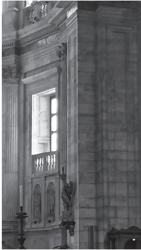
Fig. 2. Cattedrale di Como. Abside meridionale. Un tamponamento di porta al primo ordine di finestroni.

Si tratta di tre iscrizioni sepolcrali (4) e di un'iscrizione documentaria, quest'ultima oggetto specifico delle presenti considerazioni.