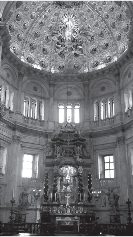
Fig. 1. Cattedrale di Como. Visione generale dell'abside meridionale.