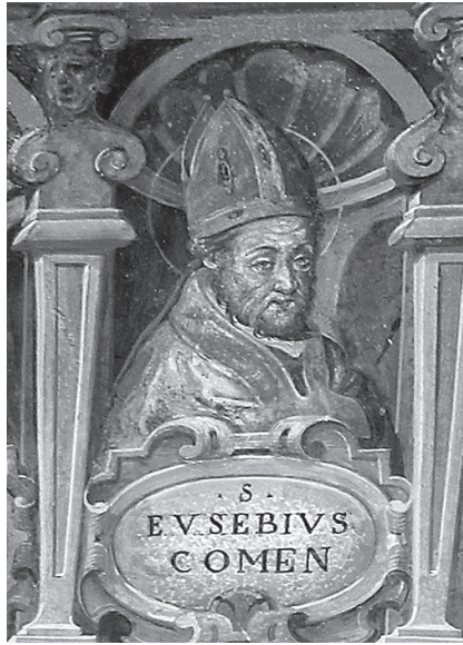
Fig. 4. Palazzo vescovile di Como. Immagine del vescovo Eusebio.

Giovi e ritenere che Eusebio fosse vescovo di Como agli inizi del VI secolo.