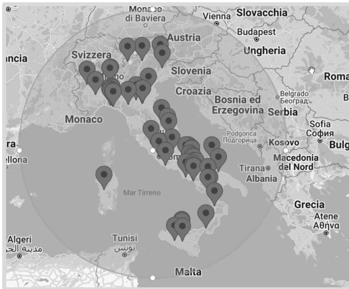
Figura 1. La geografia del sentiment sulle aree interne

nicativo iper-reale contemporaneo, i fatti mediati attraverso i social media sono chiamati anche fatti alternativi e conducono la comunicazione dalla verità alla post-verità, sostituendo i fatti reali e dando ai sentimenti più peso dell'esistenza (McIntyre, 2018).