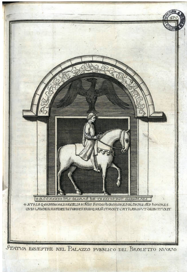
Fig. 5. Statua equestre nel Palazzo pubblico del Broletto Nuovo . Incisione all'acquaforte, da Giulini 1760.

La statua fornirà, verso la metà del secolo seguente, il modello – decontestualizzato – per un'illustrazione del volume Costumes historiques des XIIIe, XIVe et XVe siècles extraits des monuments les plus authentiques de peinture et de sculpture 11 , opera di precoce filologia sto-