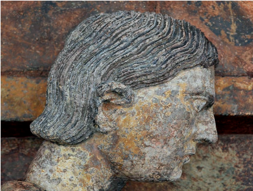
Fig. 16. Milano, Palazzo della Ragione, gruppo equestre di Oldrado da Tresseno. Veduta ravvicinata della testa di Oldrado.

figura del cavaliere. Le mani e il volto, molto abrasati, conservano tuttavia numerose tracce di colore incarnato ( Fig. 16 ); sulle guance era forse applicato un colore rosato più accentuato, mentre la parte anteriore del collo appare più scura, forse per un'alterazione del pigmento di una ipotetica successiva ridipintura; le pupille e i capelli presentano resti della coloritura bruna. La sella è in colore cuoio, mentre la staffa era forse anch'essa in origine rivestita da foglia metallica.