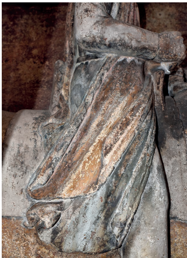
Fig. 17. Milano, Palazzo della Ragione, gruppo equestre di Oldrado da Tresseno. Veduta ravvicinata dell'abito di Oldrado.

si aggiunge una sopravveste senza maniche, o guarnacca , che presenta resti superficiali di colore giallo-ocra in due tonalità (a imitazione di una pelliccia?) che sembrano però sovrapposte a un colore rosso, che affiora in più punti (Fig. 17). L'interno della sopravveste, visibile per breve tratto in prossimità della sella sulle terga del cavaliere, conserva tracce di campitura in azzurro. L'insieme di queste osservazioni permette così di proporre un'ipotetica ricostruzione dell'assetto originario del gruppo equestre (Fig. 18), sia per la componente delle cromie sia per la presenza altamente simbolica della spada (se si accetta la proposta qui ribadita).