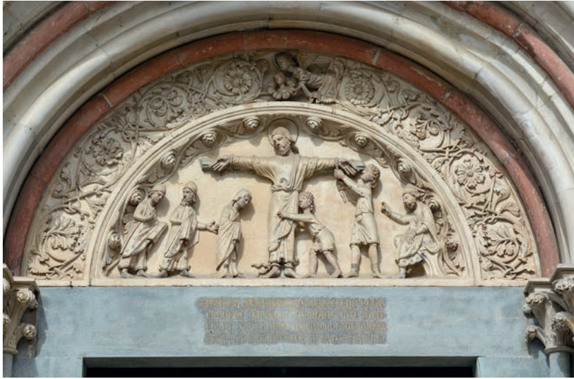
Fig. 8. Vercelli, chiesa di S. Andrea. Lunetta del portale maggiore.

Mortariensi, ma ben presto ai canonici di San Vittore di Parigi, morirà nel 1227 e una lunga iscrizione che funge da epitaffio, quindi redatta post mortem probabilmente dall'abate Tommaso Gallo, è incisa nell'architrave del portale sinistro, del tutto contestuale al portale centrale 20 .