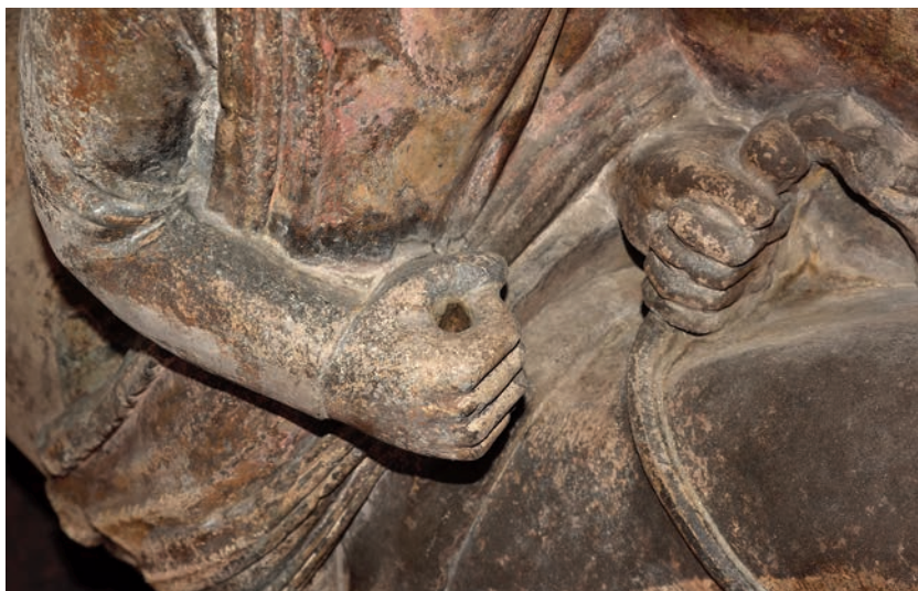
Fig. 14. Milano, Palazzo della Ragione, gruppo equestre di Oldrado da Tresseno. Veduta ravvicinata del foro nella parte superiore della mano destra destinato ad alloggiare un oggetto, verosimilmente una spada (cfr. Fig. 18), (foto S. Lomartire).

Oltre al colore dello sfondo del rilievo, un rosso-ocra piuttosto vivo sul quale restano ancora le tracce di stelle probabilmente in oro, o comunque in foglia metallica, si è potuto osservare come la grande aquila su fondo giallo-oro, descritta non come una sagoma – quale appare oggi all’osservazione a distanza – sia invece ben più ricca di dettagli ( Fig. 15 ), con becco e zampe giallo-arancio e soprattutto con il piumaggio ben descritto sulla stesura bruna del corpo dell’animale applicata direttamente sul fondo giallo della parte superiore dell’edicola, che affiora infatti dalle lacune del colore.