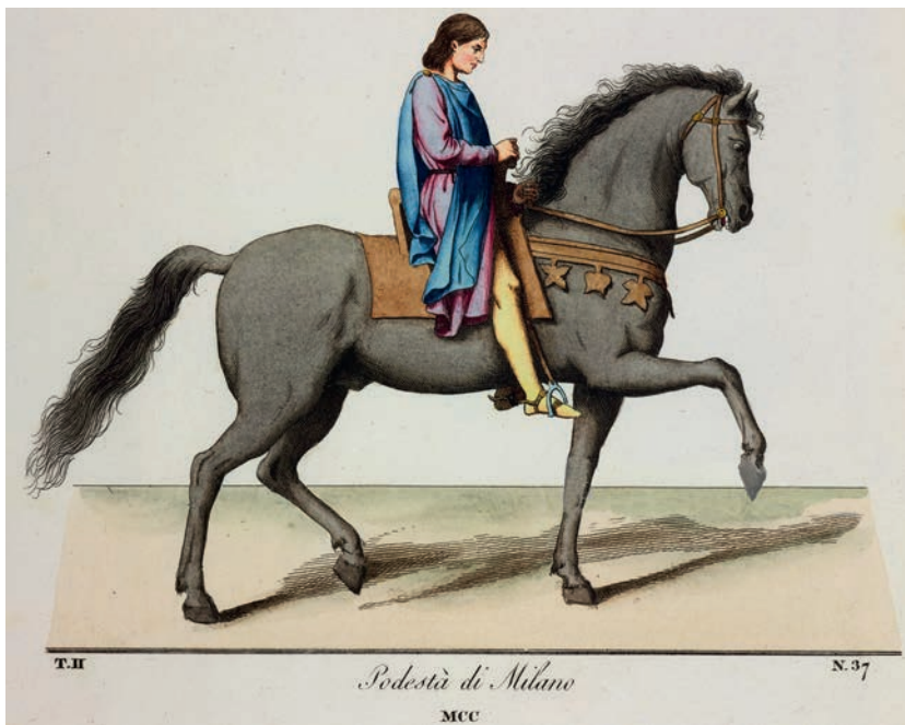
Fig. 6. Podestà di Milano . MCC, da Bonnard 1835, T. II n. 37.

rico-figurativa iniziata da Paul Mercurj nel 1827 e accompagnata da una storia di Camille Bonnard, e che curiosamente ebbe una prima edizione francese solo nel 1845, mentre la prima traduzione italiana era stata stampata a Milano ben dieci anni prima, nel 1835. L'incisione dell'edizione italiana, solo dissimile dal modello per il diverso passo del cavallo, è acquerellata con colori di fantasia ( Fig. 6 ), visto che al momento non erano probabilmente leggibili le tinte originarie – che sono state parzialmente ritrovate solo nei recenti restauri. Camille Bonnard, autore della nota di commento, nel riferirsi esplicitamente al gruppo scultoreo del Broletto, afferma infatti che i colori sono stati aggiunti «coll'ajuto delle pitture a fresco del medesimo secolo» 12 , segno dunque che all'epoca non erano evidenti i resti di colore che oggi invece appaiono chiaramente, come vedremo.