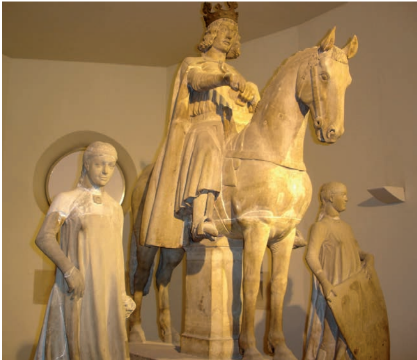
Fig. 10. Magedburgo, Kunsthistorisches Museum, Gruppo equestre (Ottone I?) proveniente dal Mercato Vecchio.

Per l'epoca precedente le attestazioni rinascimentali di ritratti equestri non mancano, e qui ricordo rapidamente le statue equestri dell'imperatore Ottone I ( Fig. 10 ) eretta nel XIII secolo su un pilastro nella piazza del Mercato di Magedburgo o quella, celebre, del Cavaliere di Bamberga ( Fig. 11 ) posta su un pilastro della cattedrale di quella città e talora considerata un cripto-ritratto di Federico II di Svevia 39 .