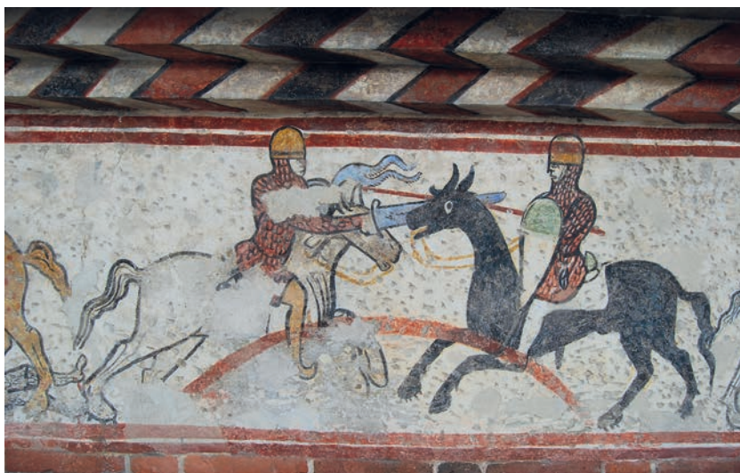
Fig. 9. Novara, Broletto. Fregio Dipinto con figure di cavalieri.

Esempio eloquente, ancorché non riferito a personaggi riconoscibili, è il fregio dipinto all'esterno dal Palazzo Comunale di Novara poco dopo il 1209, con scene di combattimenti (Fig. 9) che sono state connesse all'ideale della prouesse cavalleresca 30 o parte dei dipinti all'interno del Palazzo della Ragione di Mantova, intorno al 1250 31 ; di senso opposto si mostrano per converso le figure dei cittadini di parte guelfa banditi da Brescia raffigurati incatenati in file, recanti le insegne di famiglia e pur sempre a cavallo ma disarmati, intorno alla metà del Duecento nella cosiddetta Sala dei Cavalieri nel Broletto Bresciano 32 .