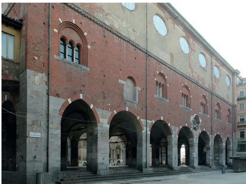
Fig. 3. Milano, Palazzo della Ragione, lato sud. Veduta generale. (Foto S. Lomartire).

Comunale (Fig. 3), soprattutto prima del sopralzo del piano superiore operato da Francesco Croce all'epoca di Maria Teresa d'Austria per creare l'Archivio Notarile 5 .