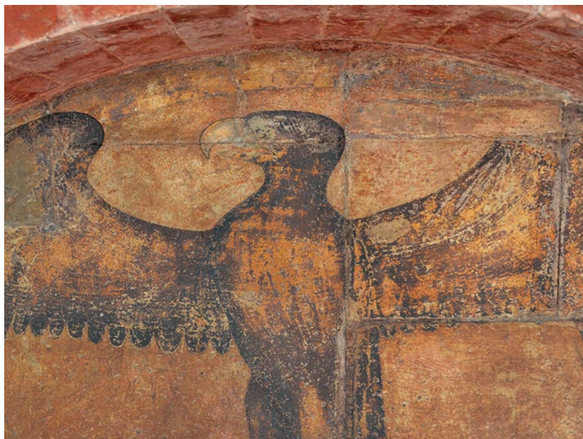
Fig. 15. Milano, Palazzo della Ragione, gruppo equestre di Oldrado da Tresseno. Veduta ravvicinata dell'aquila imperiale sul fondo dell'edicola.

rossastra, ancora ampiamente percepibile, e giunti di malta sottili e rifiniti in bianco per conferire regolarità. Questo doveva essere dunque l'assetto originario; numerose tracce di martellinatura segnalano la successiva sovrapposizione di un intonaco, che deve essere quello con decorazione a racemi visibile ancora ai tempi del Giulini e che potremmo tentativamente datare al XIV secolo, o poco oltre. È dunque possibile che in tale epoca sia stato previsto anche un rinnovamento o rifacimento della coloritura del rilievo.