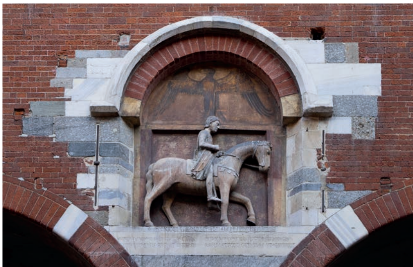
Fig. 1. Milano, Palazzo della Ragione, lato sud. Edicola con il gruppo equestre del Podestà Oldrado da Tresseno (1233) (Foto R. Dionigi).

Il gruppo equestre che, inserito in un'ampia edicola formata da marmi variegati e graniti tutti quasi certamente di reimpiego, campeggia sulla facciata meridionale del Palazzo della Ragione di Milano (Fig. 1) in una posizione di grande evidenza, ha goduto di una fortuna, anche moderna, che origina però da una precoce "sfortuna". In esso, come si sa, è rappresentato il podestà milanese Oldrado da Tresseno, in carica tra giugno 1233 e maggio 1234 1 . Montato su un cavallo da parata che procede con solenne calma verso la nostra destra, Oldrado ha il capo leggermente chinato in avanti e il volto, che può essere osservato solo da una vista laterale, ha un'espressione grave e pensosa.