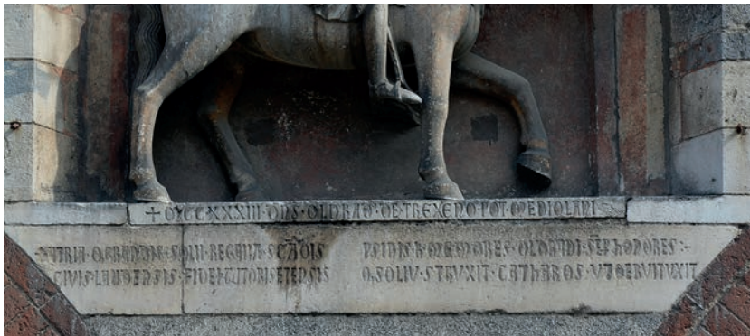
Fig. 2. Milano, Palazzo della Ragione. Iscrizioni sotto il gruppo equestre di Oldrado da Trexeno.

+ Atria · q(ui) grandis · solii · regaiia (sic! = regalia) · sca(n)dis // P(rae)sidis · h(ic) · memores · Oldradi · se(m)p(er) honores :// Civis · Laudensis · Fidei · tutoris et ensis // Q(ui) soliu(m) · struxit · catharos · ut debuit uxit ·