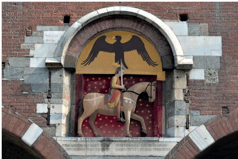
Fig. 18. Milano, Palazzo della Ragione, gruppo equestre di Oldrado da Tresseno. Ricostruzione ipotetica dell'assetto originario del rilievo, con restituzione della spada e delle probabili cromie.

Fino a che eventuali approfondimenti diagnostici sulla scultura non mutino il quadro cromatico che abbiamo cercato di ricostruire, sembra dunque che l'abito del podestà esibisse, verosimilmente nella sua finitura originaria, un'alternanza dei colori giallo e rosso che può essere considerata casuale, e comunque corrispondente ai requisiti di un abito sontuoso; in occasione di future indagini più approfondite sarà poi il caso di indagare se, in che misura e in quale versione di finitura possano essere associati alla policromia del gruppo equestre di Oldrado i colori dello stemma Da Tresseno così come sono noti dal tardo Stemmario Trivulzio.