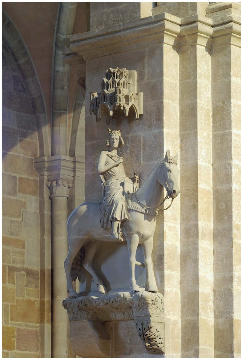
Fig. 11. Bamberga, cattedrale, interno, gruppo equestre, c. d. "Cavaliere di Bamberga" (da Gockel 2006).