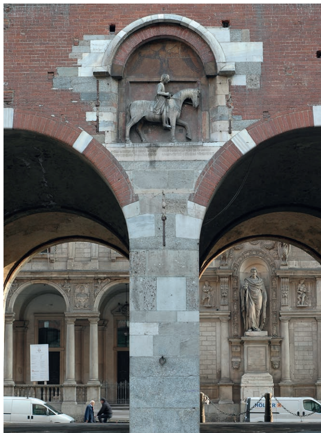
Fig. 13. Milano, Palazzo della Ragione, gruppo equestre del podestà Oldrado da Tresseno. Veduta dell'edicola e del pilastro sottostante.

La collocazione dell'Oldrado al culmine di un pilastro del portico (Fig. 13) credo sia da considerare un richiamo diretto alla collocazione su una colonna, come accadeva per la statua pavese, fatto ben evidenziato sia da Benzo d'Alessandria 41 sia da tutte le raffigurazioni del Regisole che si susseguiranno nei secoli 42 .