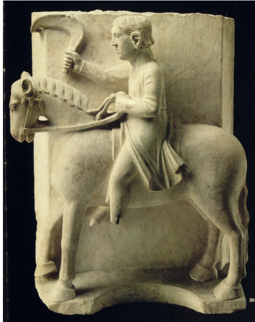
Fig. 7. Benedetto Antelami, Mese di Maggio . Parma, Battistero.

Prima di procedere nell'esplorazione dell'iconografia e del significato della figura equestre nel Broletto milanese conviene riassumere quanto fino ad ora si è detto della scultura sotto gli aspetti più propriamente storico-artistici, sui quali vorrei intrattenermi rapidamente dal momento che in questa occasione mi pare più proficuo dirigere l'attenzione verso altri aspetti iconologici, politici e di storia del diritto.