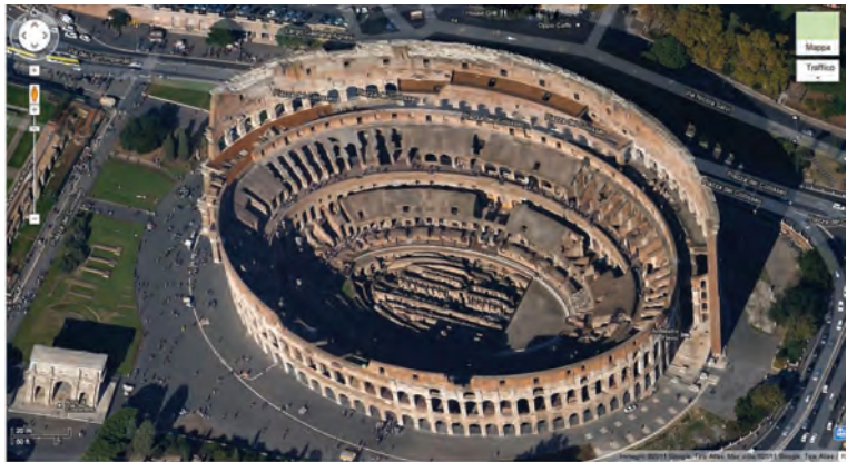
GOOGLE MAPS Immagine satellitare di Roma del servizio Google maps

Google Maps Servizio di Google lanciato nel 2005 con il nome di Google Local, che permette la ricerca e la visualizzazione di mappe geografiche di buona parte della Terra. È possibile inoltre localizzare indirizzi, monumenti, negozi, alberghi o ristoranti, richiedere percorsi stradali dettagliati tra due luoghi e visualizzare foto satellitari di molte zone. Per le zone coperte dal servizio in molti casi si riescono a distinguere edifici, strade, parchi ecc. Dal 2007 in G. M. è integrato anche il servizio di Google Street View, che consente di visualizzare fotografie a 360° gradi in orizzontale e a 290° in verticale di strade, vie e piazze di varie città del mondo a livello del terreno; le riprese sono realizzate da automezzi dotati di un sistema di fotocamere e ovvia-